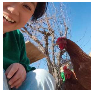
ペットのニワトリと 家庭菜園が好きです♡